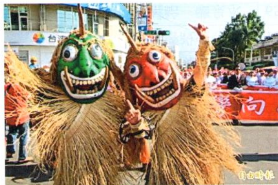
魅力森巴 FUN 埔里踩街活動熱鬧登場，