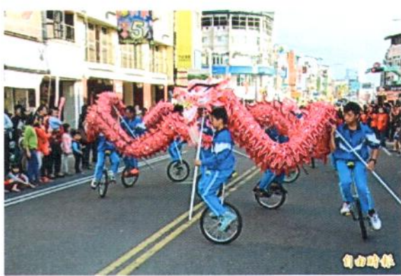
南光國小學童以獨輪車加舞龍踩街遊行，展現高超技巧。(記者佟振國攝)

日期·104年12月19日 標題·魅力林巴FUN埔里 踩街活動熱鬧登場 來源·自由時報