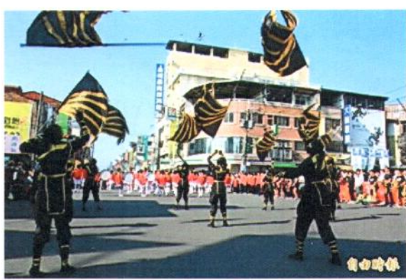
宏仁國中管樂及旗隊高拋巨旗，動作流暢劃一。