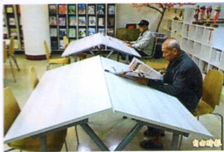
埔里圖書館加強樂齡讀者友善閱讀空間與設備，斜面書桌讓閱讀書報更輕鬆。