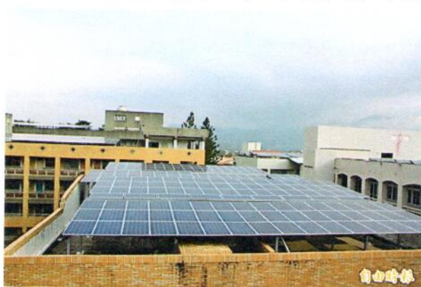
國立暨大附中將校內教學大樓屋頂出租設置太陽能發電設施。(記者佟振國攝)

日期=104年12月29日 標題=暨大附中頂樓「種電」 省錢又環保 來源=自由時報