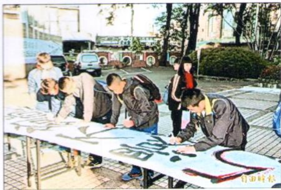
埔里高工學生昨天在校門口發起護校

國有財產署中區分署南投辦事處指出，將釐清該土地為公用或非公用，目前經營機關是埔里高工，公所應經校方同意才能撥用。