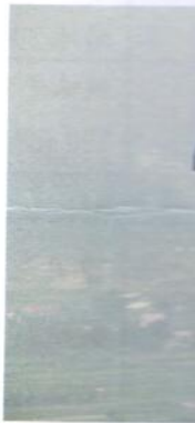
里天空灰蒙蒙 折。(記者佟