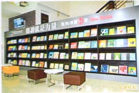
埔里圖書館歷經數月的閱讀環境大改造，正式亮麗開館。

圖書館也設計專屬吉祥物閱讀親善小天使「書書」、「福福」，推出閱讀集點活動，成為學齡前幼童閱讀的最佳良伴，圖書館服務品質再升級，讓鄉親稱讚不已，年輕讀者更表示，現在的埔里圖書館，有誠品下鄉展店的感覺。